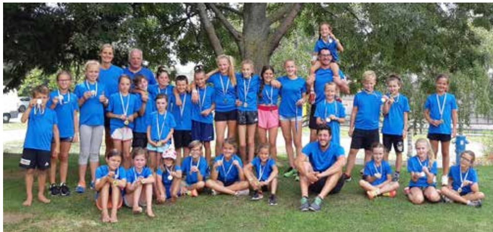
Gruppenfoto Leichtathletikcamp Sommer 2019

Wir Trainer*innen des LAC Vinschgau hoffen sehr, dass wir im kommenden Sommer wieder viele Kinder und Jugendliche bei unserem Leichtathletik-Camp in Mals begrüßen und mit ihnen sportliche und vor allem lustige Tage gemeinsam verbringen können. Wir bedanken uns bei der Gemeinde Mals, dass wir auch in diesem Jahr auf ihre Unterstützung zählen hätten können. ■