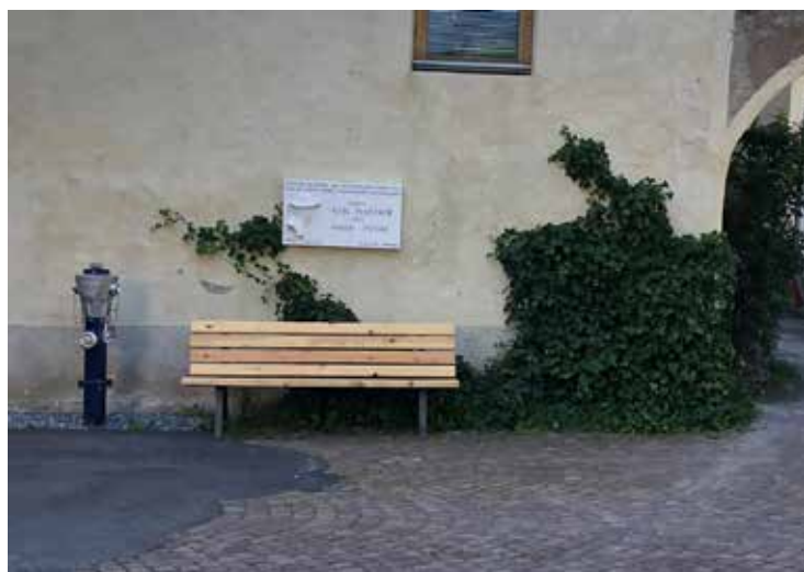
Einladung zum Verweilen am Karl Plattner Platz, erst kürzlich bekam die Bank einen schönen Platz