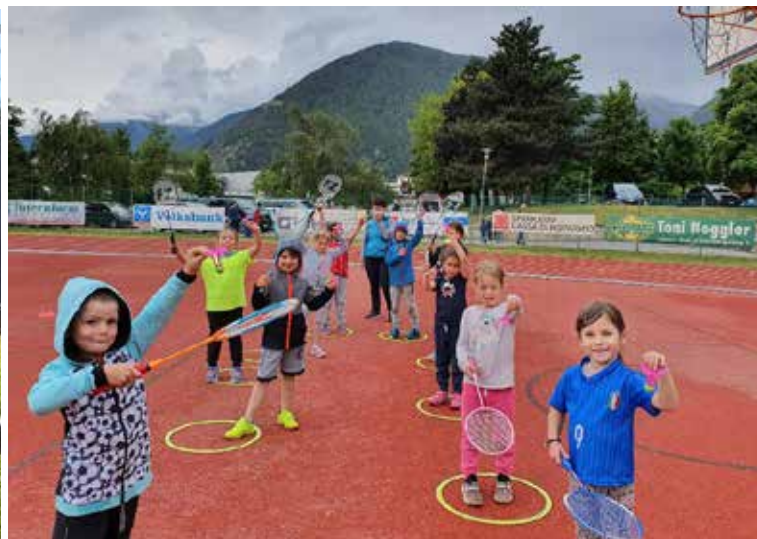
Auch unsere Jüngsten freuen sich übers Training im Freien auf der Laufbahn