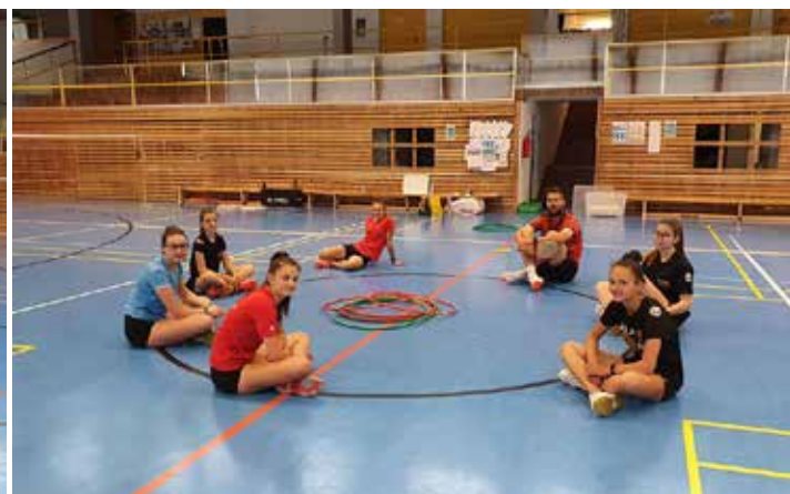
in Kleingruppen haben wir in der Mittelschulhalle angefangen