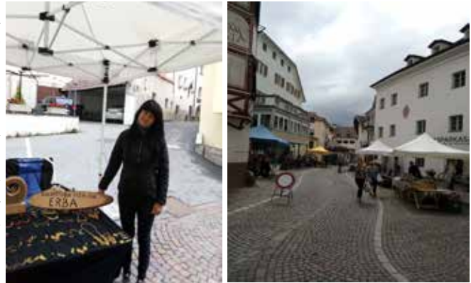
foto del mercato dei contadini a Malles