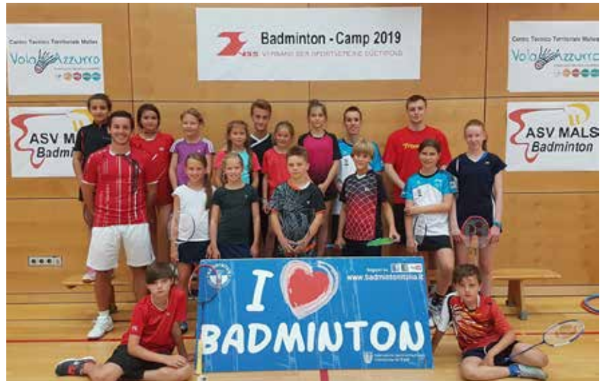
VSS Camp in Mals