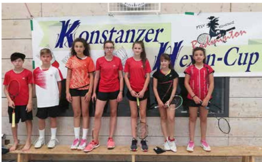
Die jungen Nachwuchsspieler des ASV Mals beim Hexen Cup in Konstanz

unserer Jüngsten über die Grenzen zu schauen, und sich einmal das Niveau im Ausland anzusehen.