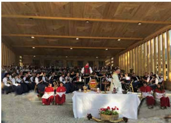
Die Musikkapelle und die beiden Chöre umrahmten die hl. Messe