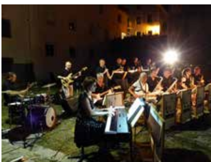
Die Big Band Mals