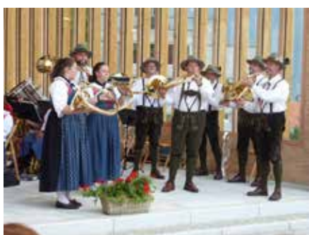
Die Jagdhornbläsergruppe St. Eustachius