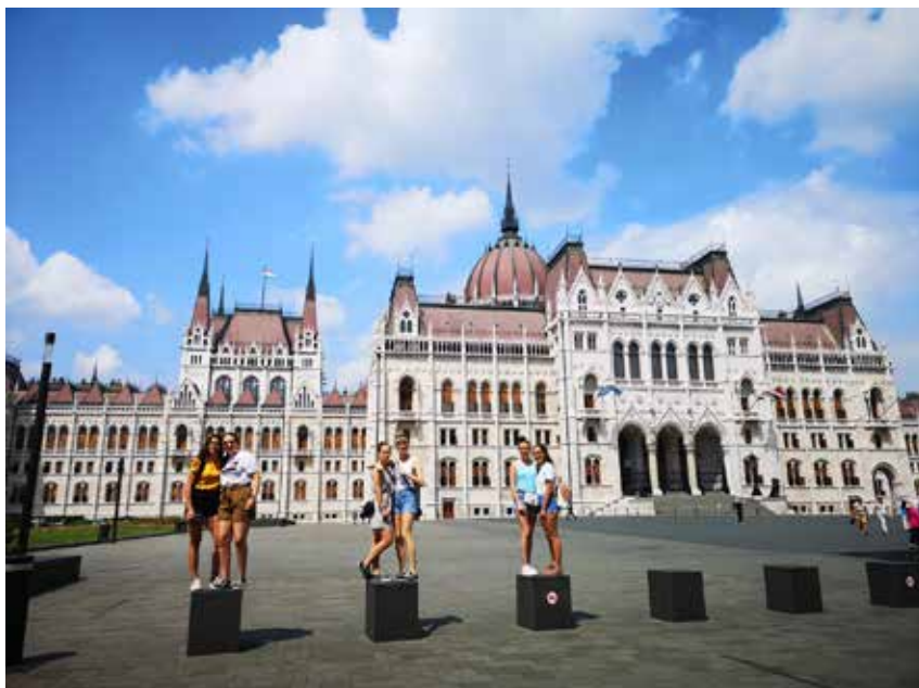
Vor dem Parlament in Budapest

Es war eine sehr gelungene Städtereise. Da waren auch schnell wieder die Strapazen der Heimreise vergessen: aufgrund eines Gewitters mussten wir uns die ganze Nacht auf dem Flughafen um die Ohren schlagen. Wir haben viel spannendes und schönes erlebt, hatten viel Spaß zusammen und wir sind gespannt, welche Stadt wir als nächstes unsicher machen werden. █