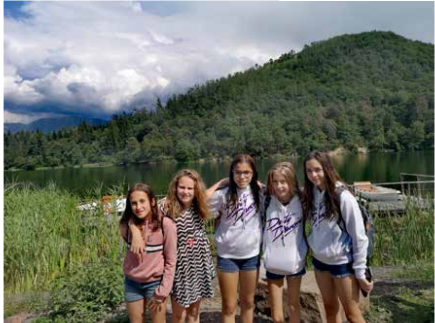
am Montiggler See

Am letzten Tag konnten wir dann etwas länger schlafen. Nach einem späten Frühstück haben wir noch zusammen Lasagne gekocht, die Nägel lackiert, einen Film geschaut und den Tag langsam und gemütlich ausklingen lassen. Es waren tolle drei Tage mit viel Abwechslung, Action, Teamwork, „Mädelskram“, Kochen und viel Lachen. Es sind auch tolle Ideen für die Neu-Gestaltung des Mädchenraums entstanden, welche wir dann nach dem Sommer umsetzen werden. ■