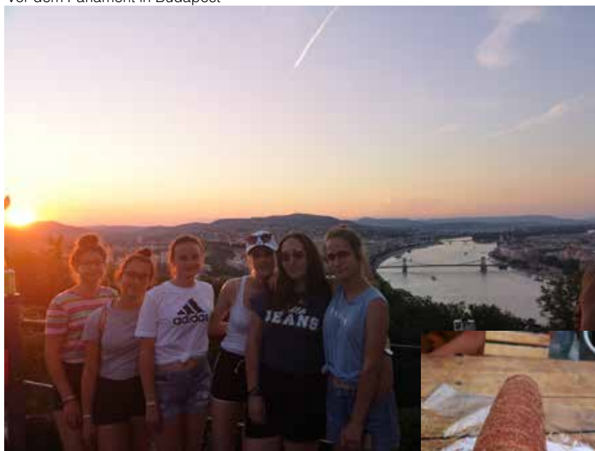
Bei Sonnenuntergang in Zitadelle