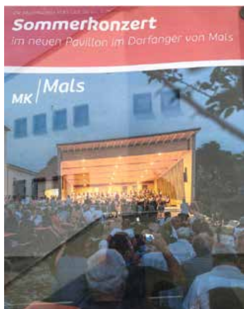
SOMMERKONZERT am 11. August um 20,30 Uhr im Pavillon von Mals