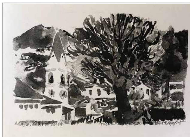
BILDERAUSSTELLUNG IN DER BIBLIOTHEK MALS

Trude Saltuari-Oberegger stellt aus für den Malser Weg täglich von 15 - 19 Uhr bis 10. August