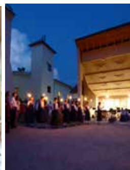
Die Volkstanzgruppe Mals