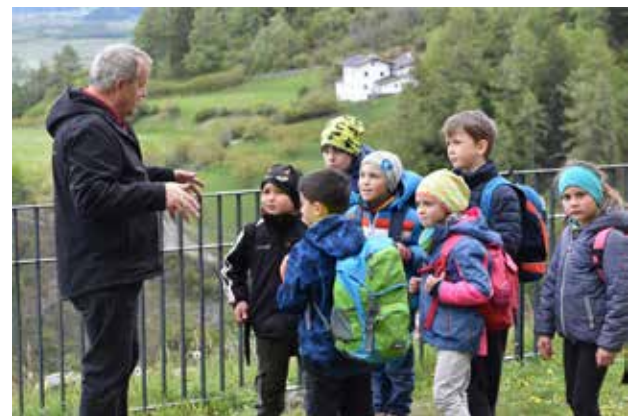
... und brachten uns an verschiedene Orte.