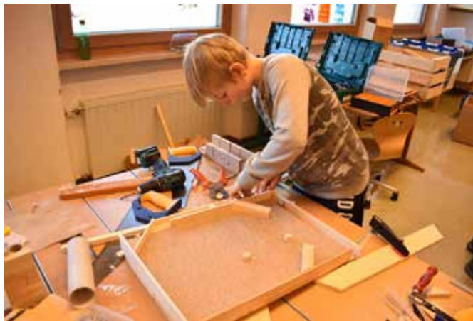
Wir haben gebastelt ...