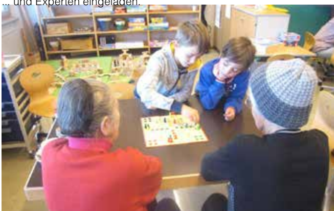
Wir luden die Senioren zum Spielen ein.