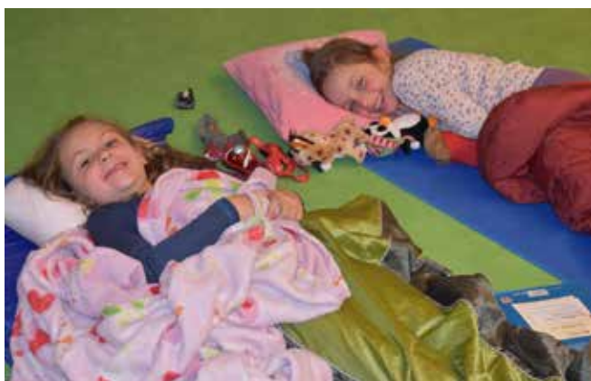
... und in der Schule geschlafen.