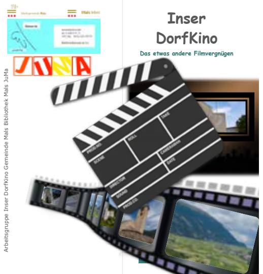
Arbeitsgruppe Inser DorfKino Gemeinde Mals Bibliothek Mals Junia