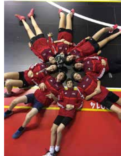
und das zweite Bild nach dem Sieg der Mädchen und dem 4. Platz der Jungs.

ten, viel Kultur und nicht zuletzt mit dem Sieg des Mädchenteams werden den Teilnehmern noch lange in guter Erinnerung bleiben.