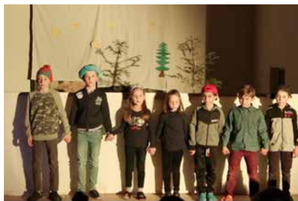
Wir haben ein Weihnachtsstück eingelesen ...