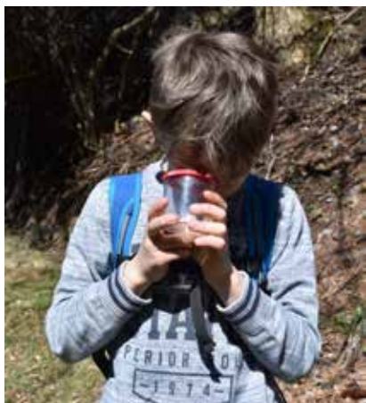
... und untersucht