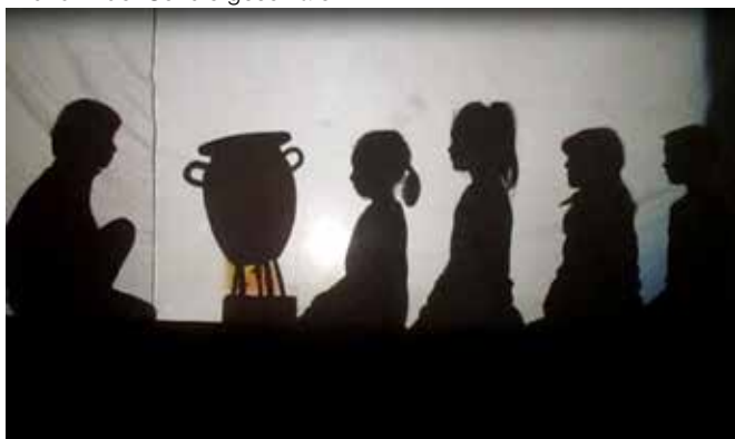
... und ein St.-Martins-Stück.

Wir wünschen allen Lesern einen schönen Sommer!