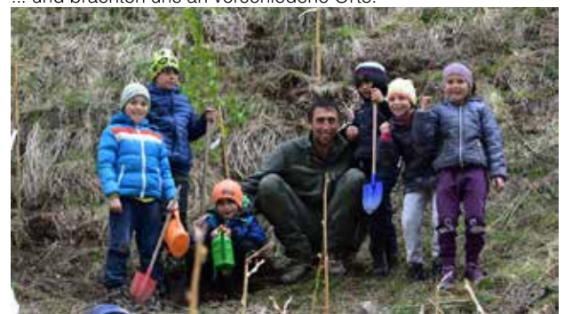
Wir haben Bäume gepflanzt ...