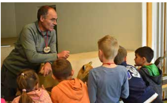
... und Experten eingeladen.