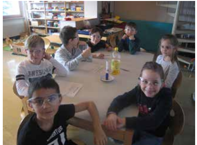
Experimente fanden alle toll.