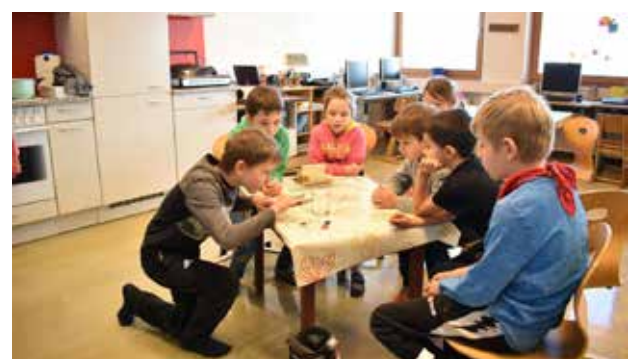
Wir haben präsentiert ...