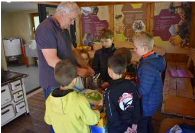
Lehrausflüge lockerten den Unterrichtsalltag auf ...