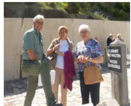
Alcuni momenti dei visitatori all'abbazia nella giornata delle porte aperte