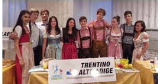
Schnappschüsse von der Oberschul-Italien-Meisterschaft auf Sardinien, einmal im Tiroler-Look