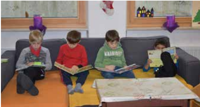
In angenehmer Sitzposition wurde gern gelesen.

7 Kinder schließen dieses Schuljahr in Planeil ab. Ein Schüler wird im Herbst die Mittelschule besuchen, ein Schüler zieht weg, in die erste Klasse wurde kein Kind eingeschrieben. Die Zukunft der Planeiler Schule sieht nicht rosig aus. Dieses Schuljahr war eine weitere Bereicherung für das Dorf, für die Schüler und für uns Lehrpersonen. Mit folgenden Bildern möchten wir einen fotografischen Rückblick auf das Schuljahr 2018/19 werfen.