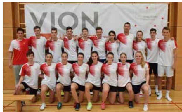
Pfingstturnier mit Malser Sieg : Im Bild die drei Mannschaften, die in der A-Klasse gestartet sind!

Nach dem Turnier gab es die schon zur Pflicht gewordene Pfingstfeier mit guter Musik, Mitternachtsgeburtstagsstorte, viel Herzblut und vielen zwischenmenschlichen Beziehungen. Danke an alle Helfer, an unsere Sponsoren, allen voran VION, die das Event möglich gemacht haben. Ohne die Unterstützung unserer Sponsoren wären solche Events nicht möglich!