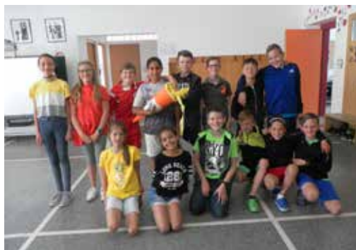
Bild der Siegerklasse

Auch heuer wurde an der Grundschule Mals wieder fleißig gelesen und bei Antolin wurden viele Punkte gesammelt. Wir Lehrpersonen freuen uns, wenn Kinder die Freude am Lesen entdecken. Ganz bestimmt macht das Lesen auch in den Sommerferien die Tage bunt und unterhaltsam.