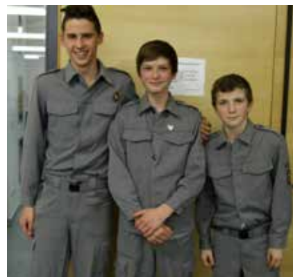
Tre giovanissimi allievi vv. ff. quasi pronti a rimpiazzare altrettanti soci anziani