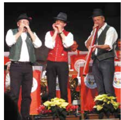
das Beilngrieser Mundharmonikatrio