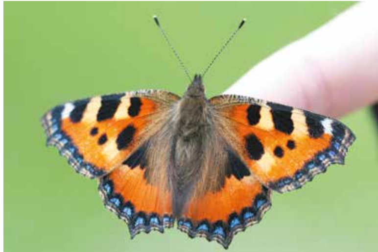
Frisch geschlüpfter Kleiner Fuchs (Aufzucht in der Mittelschule).

Männchen und Weibchen sind gleich gefärbt. Den Namen hat dieser schöne Falter wohl von der lebhaften orangebraunen Grundfarbe. Ferner hat er einen weißen Fleck an der Vorderflügelspitze und alle vier Flügel tragen blaue Flecken am Außenrand. Die Eier werden haufenweise, etwa 80 bis 200, auf die Unterseite von Brennnesselblättern abgelegt. Die Raupen leben gesellig in einem Gespinnst, das sie auf Brennnesseln, ihrer einzigen Futterpflanze, anfertigen. Auf den Brennnesselbeständen um Almhütten treten sie oft in großen Mengen auf. Die Raupen lassen sich leicht zu Hause weiterzuchten. Weil die Entwicklungsdauer zum Falter kurz ist, ist die Aufzucht dieses Schmetterlings zu Lehrzwecken in der Schule beliebt. Zur Verpuppung verlassen die Raupen zumeist die Futterpflanze und legen oft große Strecken zurück, bis sie unter einem Stein, einer vorspringenden Gebäudekante, einem Ästchen oder einem Pflanzenstängel einen geeigneten Platz gefunden haben, um sich als Stürzpuppe aufzuhängen. Die Falter schlüpfen nach