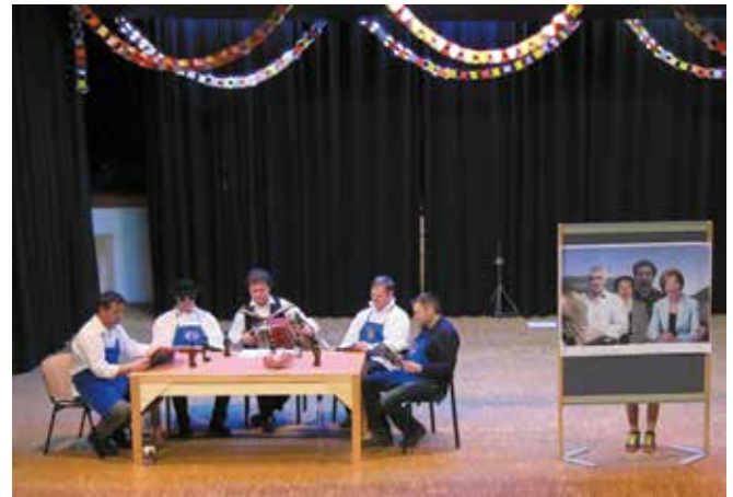
Faschingsrevue der Musikkapelle