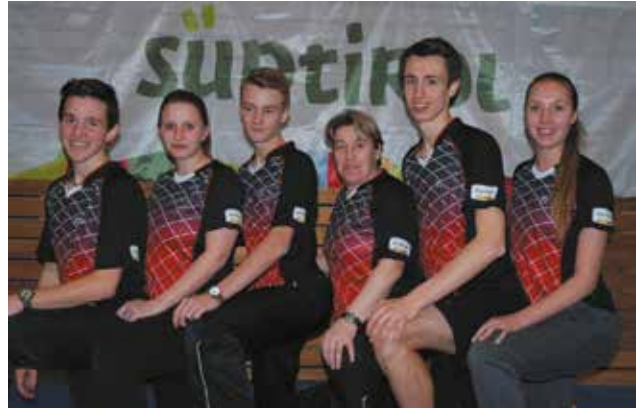
Unsere Serie A Mannschaft mit neuem Sponsor! Die einzige Mannschaft in der italienischen Serie A, die nur mit Spieler aus den eigenen Reihen spielt, und wohl auch die jüngste Mannschaft von allen!

Trotzdem ist man guter Dinge und eigentlich mehr als zufrieden, da der ASV Mals die einzige Mannschaft