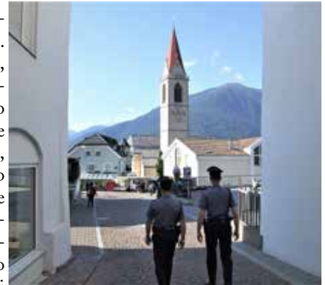
Una pattuglia di carabinieri a controllo del nostro territorio

del distributore di benzina, una volta accortosi dell'ammacco di cassa. A svelare per bene il modus operandi, e anche informazioni preziose per risalire all'identità del colpevole, sono state le immagini delle videocamere della pompa di benzina. Dai filmati, si vede la persona che dopo aver fatto il pieno all'auto se ne va senza passare alla cassa per il pagamento. Le indagini sono durate alcuni giorni. I carabinieri del posto sono riusciti a quanto si apprende da ambienti ben informati a risalire all'identità del ladro di benzina scoprendo che trattasi non di un ladro bensì di ladra, che avrebbe agito camuffando il proprio aspetto nel tentativo di sfuggire alle forze dell'ordine. La donna sarebbe una giovane automobilista proveniente da fuori comune. Che avrebbe scelto il distributore di Malles forse per un questione logistica. Adesso saranno i carabinieri a fare luce su tutta la vicenda.