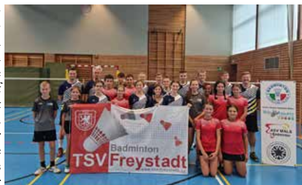
Trainingscamp mit dem TSV 1906 Freystadt