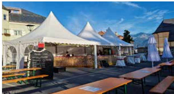
Badminton- Stand beim Malser Kirchta